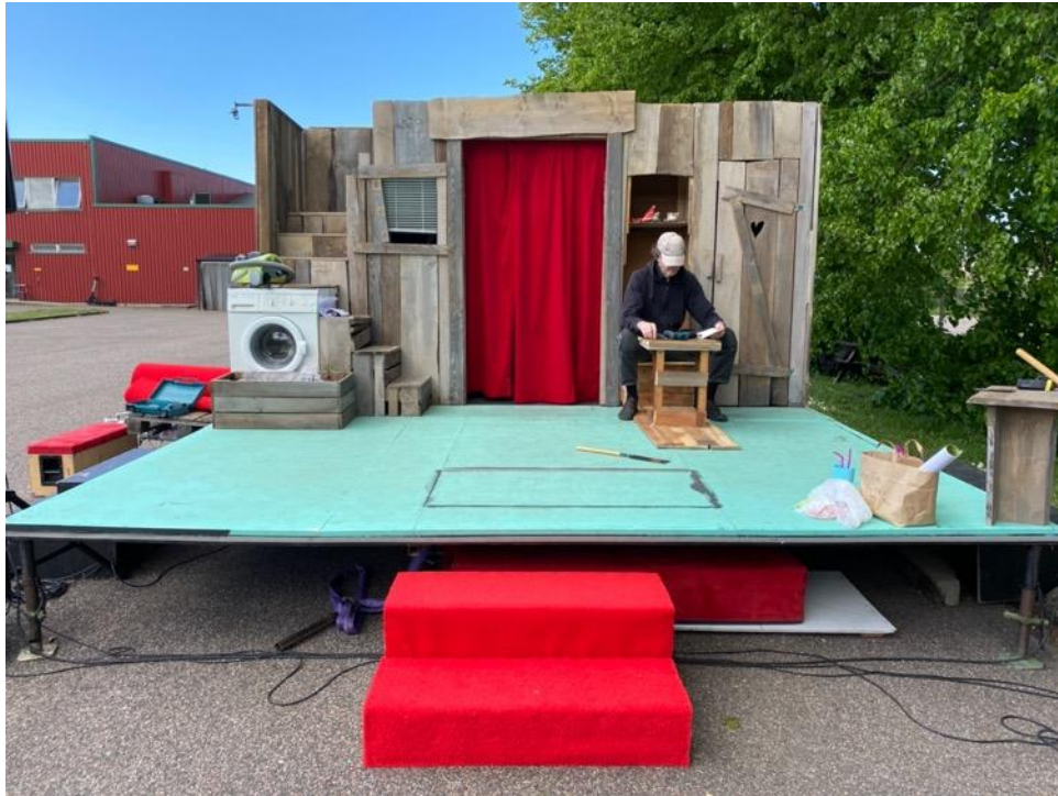
Foto på den nerfällda scenvagnen under pågående bygge.