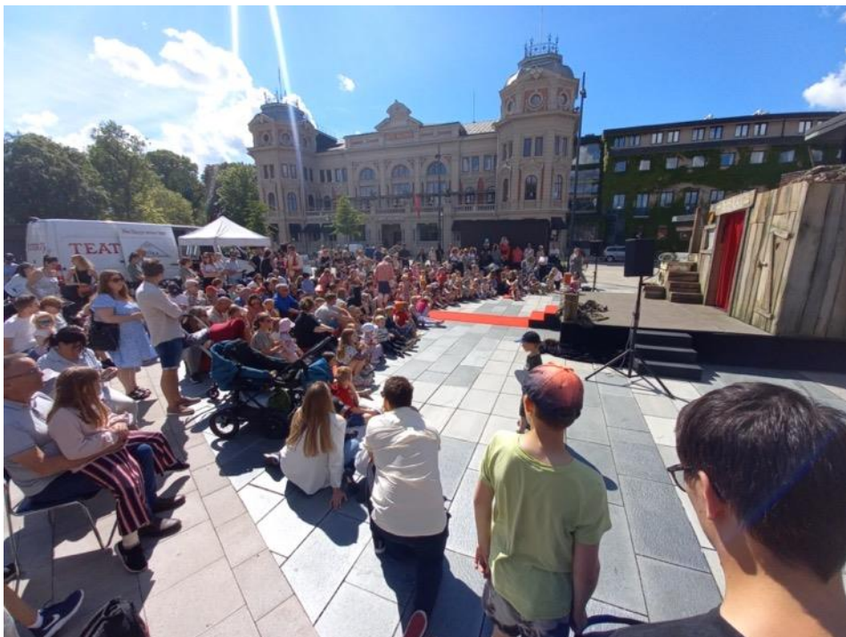
Foto från föreställningen, Skövde juni 2022. Scenvagnen (till höger). I mitten går en röd matta ut genom publiken. Längst bak från publiken sett (till vänster i bild) står vår teknikbil.